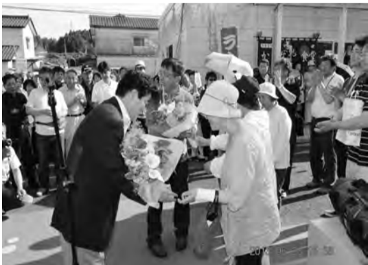
浜風商店街でのセレモニー

をはじめ、被害から復旧した「道の駅よつくら港」・「いわき市観光物産センターら・ら・ミュウ」等の施設を見学した。特に「浜風商店街」では、商店街役員久野浜商工会の職員等に出迎えられ、セレモニーも行われ交流が図られた。